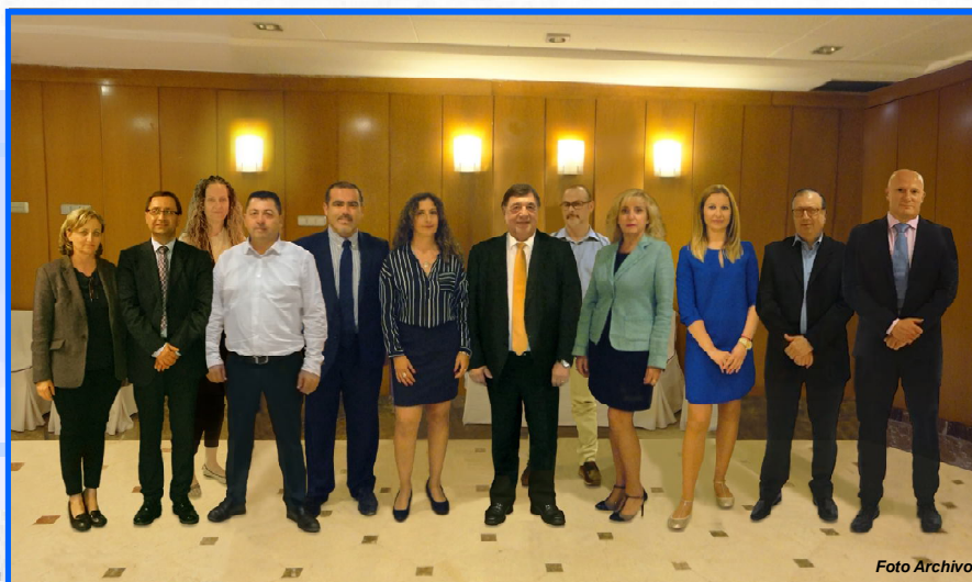
Miembros Directivos, Consultores y Responsables de Áreas de «INGESA»-«ATP»

Dicho Informe se remitió con fecha 22-05-2023 de forma personal a cada uno de los Sres. Asociados, a sus correos electrónicos obrantes en el seno de la Asociación. Igualmente y para una total notificación, se colgó en la página web de nuestro Colectivo Profesional.