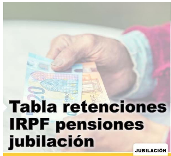
Tabla de retenciones del IRPF en la pensión de jubilación para 2024

Estas tablas son estatales, aunque también hay tipo impositivo a nivel autonómico. Dependiendo de dónde viva, será aplicable una retención u otra, como se verá a continuación.